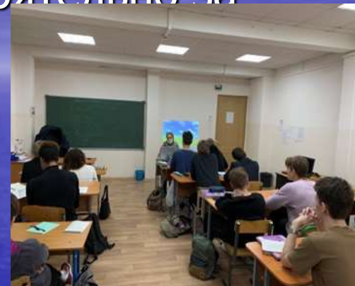
Междисциплинарное информационно- коммуникативное мероприятие по профилактике аддитивного поведения 19.10.2020 на базе КСиПТ